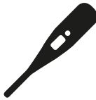
Verhoging of koorts